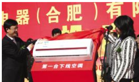
董明珠总裁和张晓麟常务副市长为合肥生产的第一台格力空调揭幕

格力电器董事长朱江洪在致辞中表示，为了适应市场及自身发展的需求，格力电器计划在未来1到2年时间内，将进行第二期工程的建设，把家用空调年产能扩大到500万台